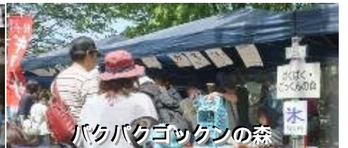
バクバク ゴッゲンの森