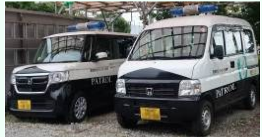
青色回転灯パトロール車

パトロール実施者を増やすための青色回転灯パトロール実施者講習会（毎年 6 月）を開催していますので、関心のある方はぜひご参加ください。