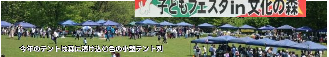
今年のテントは森に溶け込む色の小型テント列