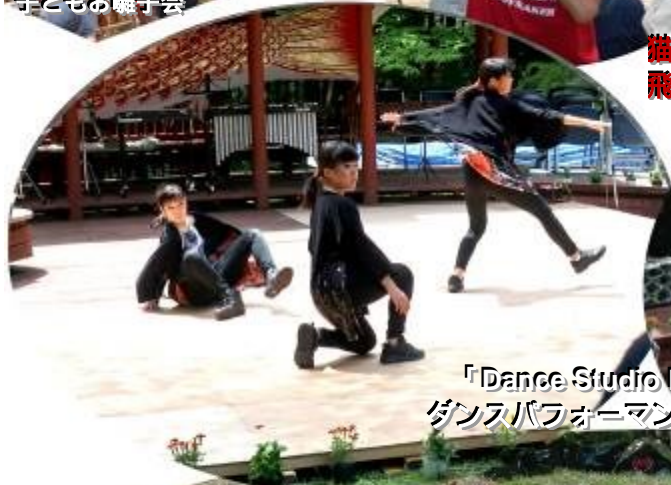
「Dance Studio BRes」 ダンスパフォーマンスーゴマ