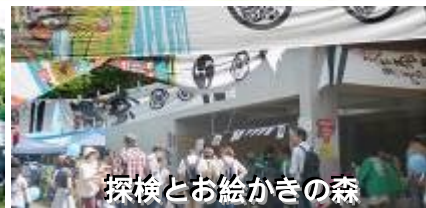
探検と お絵かきの森