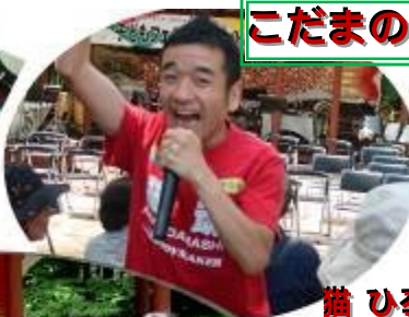
猫ひろし 飛び入り