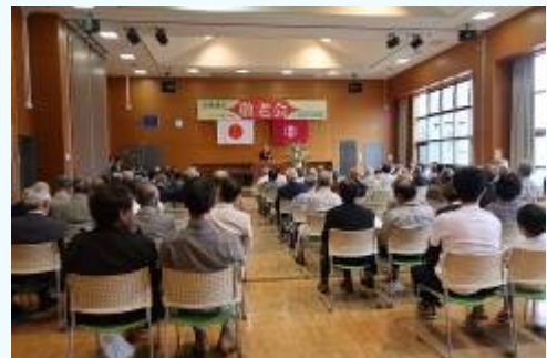
平成30年度の豊郷地区敬老会

対象者：昭和20年4月1日以前に生まれた方 問い合わせ：豊郷地区社会福祉協議会 （豊郷地区市民センター内 電話 660 - 2340）