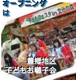
豊郷地区 子どもお囃子会