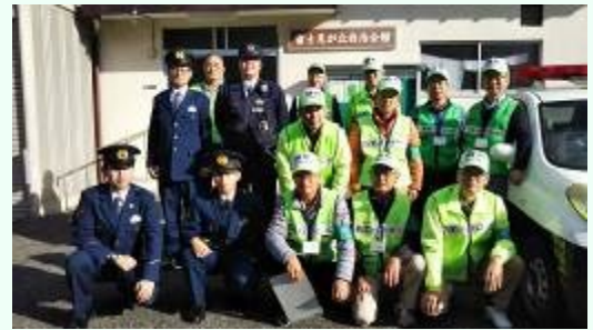
富士見が丘地域安全防犯パトロール

活動状況：1. 地域内の巡回 ・下校時の立哨・見守り、夜間パトロール ・青パトの巡回（月 3 回） ・地域安全歳末パトロール（山本町交番と連携） 2. 夜間パトロールの実施 ・民生・児童委員と連携して作成したマップを基に、一人暮らし高齢者の見守り活動 ・防犯灯の点検 ・違反広告物の除却活動等