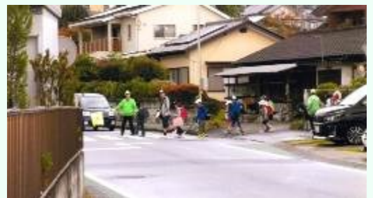
山本防犯パトロール

山本防犯パトロール隊は自治会役員、班長、子ども会、消防、体協、恵友会（老人会）による役員約 100 名により実施しています。子ども達の見守りを毎日下校時間帯に数名により立哨、毎月第 2 金曜日昼下校時間帯に山本交番に集合して児童の自宅近くまで送る、土曜日夜 7 時に山本交番に集合し役員、班長、隊員でパトロール実施。第 4 金・土曜日の毎月 2 回実施しています。（30 年度延 380 名参加）