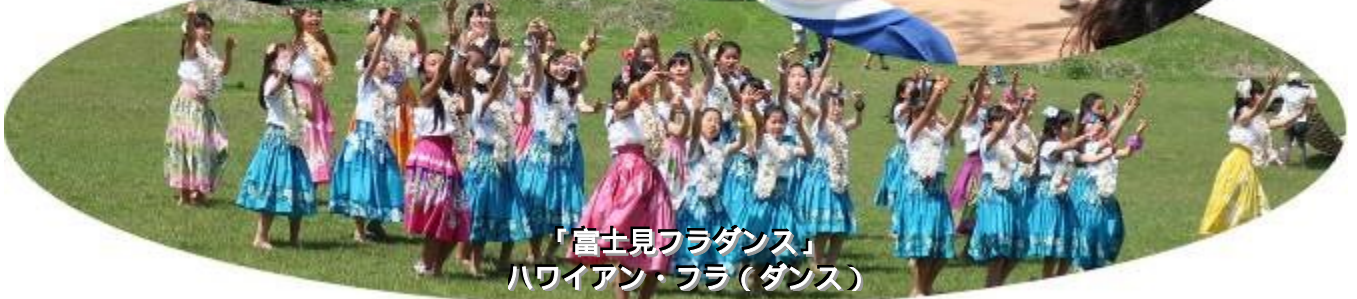
「富士見フラダンス」 ハワイアン・フラ(ダンス)